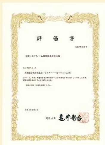
建設技術評価証明書 (第96107号)