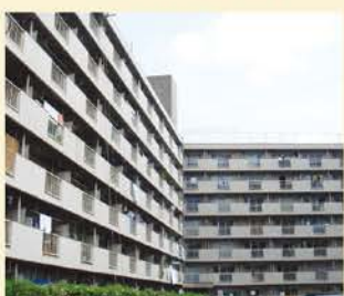
現場全景(千葉県某物件)