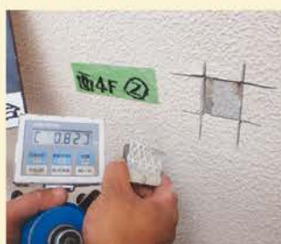
GNSフィラー付着力試験