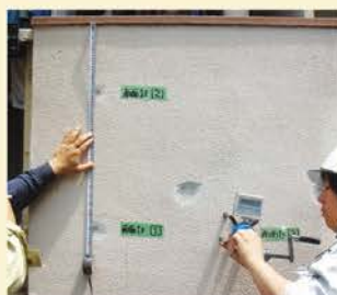
GNSアンカーピン引張試験