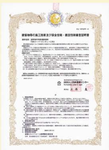
建設技術審査証明書 (BJC一審査証明-43)

外壁タイル仕上げ、モルタル仕上の剥落防止工法として平成2年から20年以上の 実績があり、保全技術・技術審査証明書と建設技術評価証明書を取得し、独立行 政法人都市再生機構の外壁複合改修工法品質判定基準に合格している外壁落下 防止工法として施工性・機能性に優れた工法です。