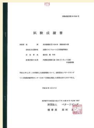
UR都市機構試験成績書